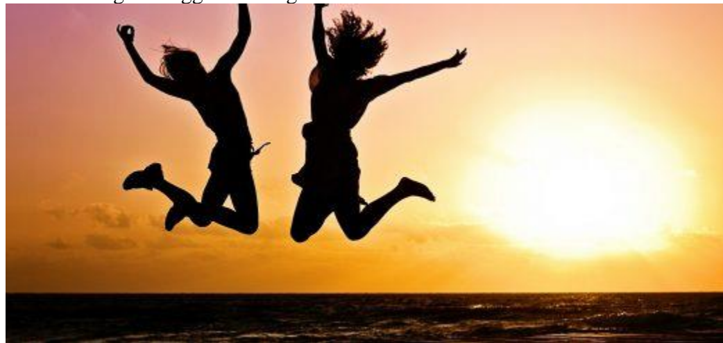
God hälsa och välbefinnande.

Investeringar i hälsa genom förebyggande insatser och modern och effektiv vård för alla gynnar samhällets utveckling i stort och skapar förutsättningar för människors grundläggande rättigheter till välbefinnande.