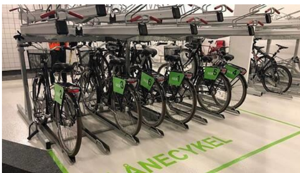
Låncyklar för SEBs anställda.